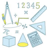
ダウンロードボタン (文字可変)